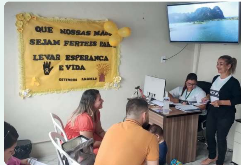
Realização de PALESTRAS