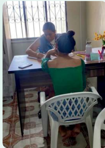
Atendimento ASSISTENTE SOCIAL